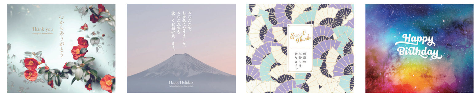
J 心からありがとう K お世話になりました。宜しく願い致します。 L 感謝の気持ちを贈ります M Happy Birthday

熨斗では堅苦しい時、暮らしの中でのちょっとした贈り物も、贈る相手の気持ちを考えて、思いをプラスする大好評のメッセージ掛け紙。お歳暮やお年賀としてもピッタリなデザインとなっております。どれも無料でお付け出来ますので、ぜひ楽しんでお選び頂ければ幸いです。